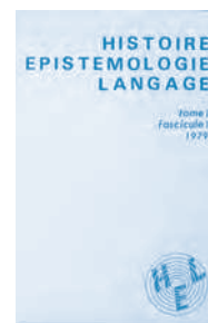
Couverture du 1 er numéro d'HEL, 1979

Il défend l'idée d'un modèle historique par accumulation des connaissances contre une histoire purement narrative. 17 En dix-huitième et encyclopédiste, Auroux tient à la construction de grands outils pour l'histoire